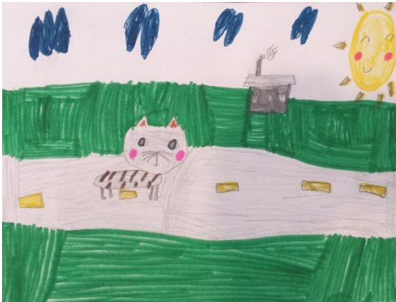
"Sunny day for a walk" K.D. (8 y.o.)