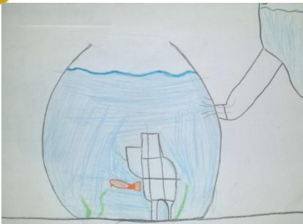
« Aquarium » A.C. (9 ans)