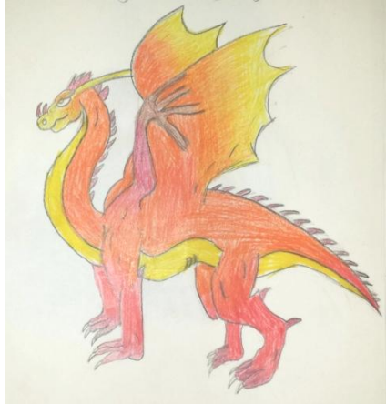
« Girly Dragon » A.N. (13 ans)