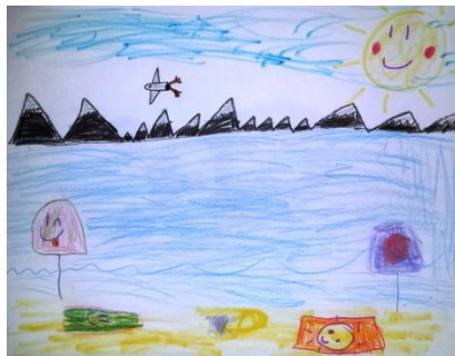
« À la plage » K.D. (8 ans)