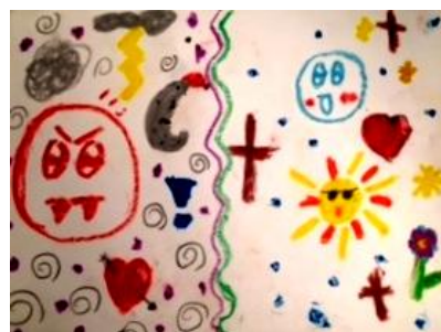
C.T., 8y.o. « Bright and dark »