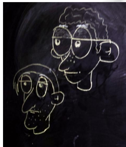
M.M., 12y.o. « Black board »