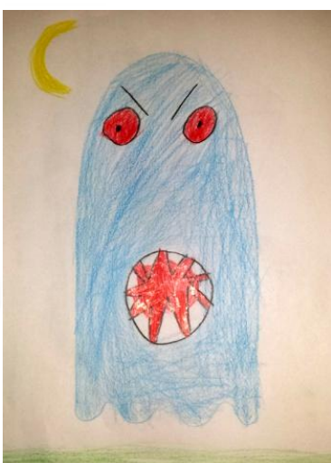
A.C., 8 ans « Fantôme! »