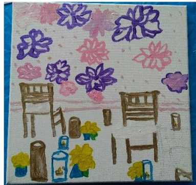
“Flying house” M.M. (11 y.o.)